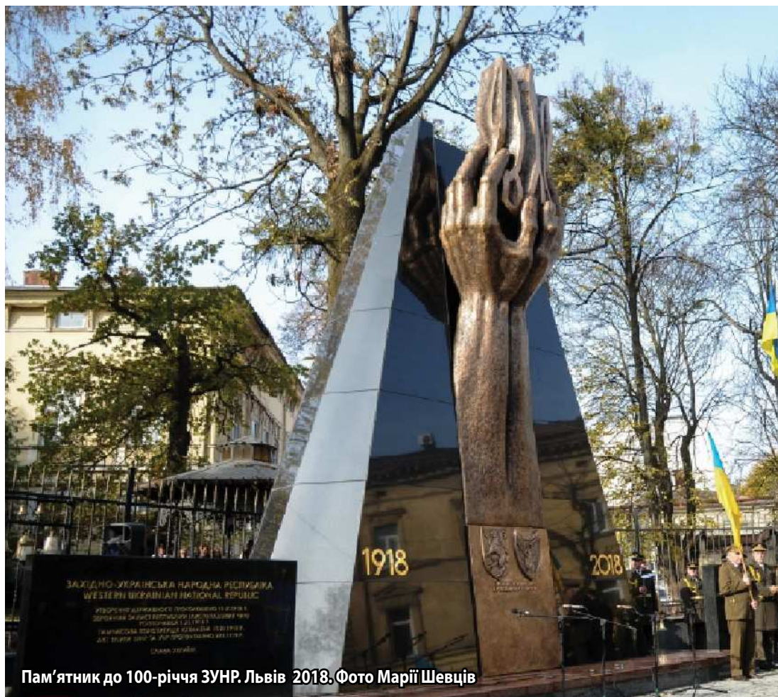
Пам'ятник до 100-річчя ЗУНР. Львів 2018.

26 жовтня УНРада визнала українську етнографічну територію колишньої Австро-Угорської імперії – «Східну Галичину з граничною лінією Сяну з влученням Лемківщини, північно-західну Буковину та