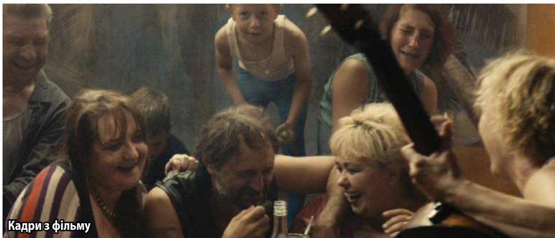
Кадри з фільму

Редакція газети «Українське слово – Літаври»