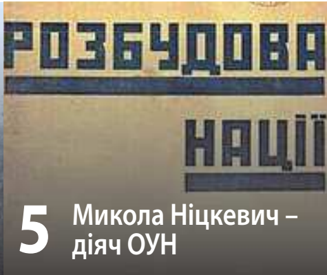
5 Микола Ніцкевич – діяч ОУН