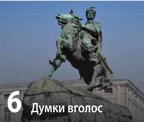
6 Думки вголос