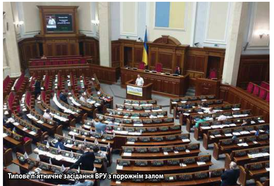
Типове п'ятничне засідання ВРУ з порожнім залом

Наші реально дуже дорогі депутати настільки віддалилися від народу, що отримуючи величезні виплати з бюджету за роботу в парламенті, не менш реально «забивають» на цю роботу. Вони або взагалі не ходять, або, зареєструвавшись зранку, займаються своїми справами, але тільки не виконанням своїх прямих обов'язків. Їх немає в залі засідань у дні сесій навіть в умовах фактично чотириденного робочого тижня, коли сесії відбуваються усього два тижні на місяць (тоді коли вся бюджетна сфера працює на «п'ятиденці» і щотижня, про найманих працівників у комерційному секторі чи торгівців на ринках навіть не згадуємо). Вони не ходять на засідання парламентських комітетів. Більшість із них не відзначилася жодним законопроектом. І абсолютна більшість їхніх прізвищ країні просто невідома. Але ж кожен, хто працює знає, що існує Кодекс законів про працю України. І за цим документом кожен працівник має виконувати свої посадові обов'язки. Звичайного громадянина за три дні неявки на роботу без поважної причини можуть звільнити. А народного депутат – зась! За неналежне