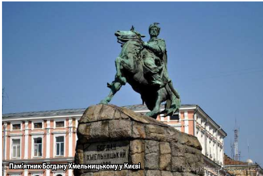
Пам'ятник Богдану Хмельницькому у Києві

викладання у закладах освіти державною українською мовою і для представників національних меншин) засвідчує, що це змагання є реальним і доволі жорстким. Для кого ми за свої кошти готуємо добрих конкурентних фахівців, якщо всі вони після отримання освіти в Україні будуть розлітатися по світу, без жодної думки про те, а хто ж буде будувати рідну Україну? Бо цим суперрозумним «технократам» – «що Хмельницький, що Щорс однакові, бо і той на коні і той на коні». То кому тоді потрібна така освіта? І до чого тоді усі зусилля по збільшенню витрат державного бюджету на освітню галузь? Це все одно, що викидати гроші «на вітер»!