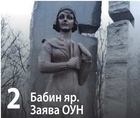
2 Бабин яр. Заява ОУН