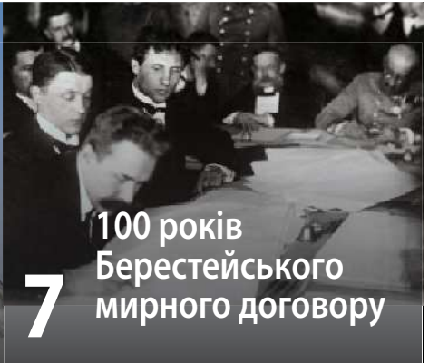
7 100 років Берестейського мирного договору