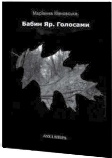
Маріанна Кіянвська. Бабин Яр. Голосами. К.: Дух і літера, 2017. – 112 с.

Найцікавіше з поезією відбувається тоді, коли вона виходить поза свої межі. Коли вона не зосереджується виключно на ліричному суб'єкті й починає коментувати та пояснювати речі, що не вкладаються в традиційні ліричні переживання й рефлексії. Поезія, виведена з суто поетичного поля, набуває цілком іншої ваги. Вона підключається до зовсім іншої енергетики, вона починає функціонувати на новій для себе території, за нових