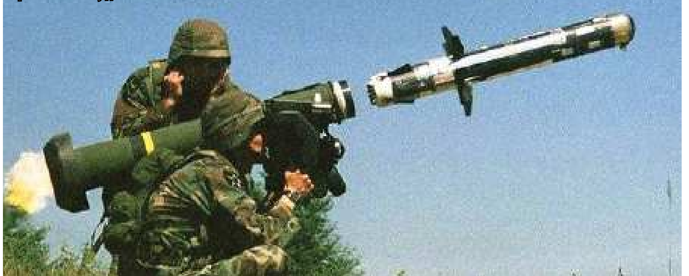
Грізний Javeline у дії

В цій ситуації Україні слід очікувати чого завгодно. Щоб вистояти у сучасному відкритому протистоянні з Росією треба, перш за все, консолідувати суспільство перед зовнішньою загрозою і не допустити внутрішньої дестабілізації і розвалу. Ключовим тут є повернення віри людей у національну та соціальну справедливість, досягнення помітних результатів економічного розвитку та поліпшення умов життя простих громадян. Внутрішня стабільність стане додатковим важливим фактором морально-психологічного зміцнення Збройних сил України, бо навіть озброєні найсучаснішою зброєю воляки потребують внутрішньої віри і впевненості у тому, що вони ризикують життям і гинуть за державу своєї мрії і мрії покоління українців.