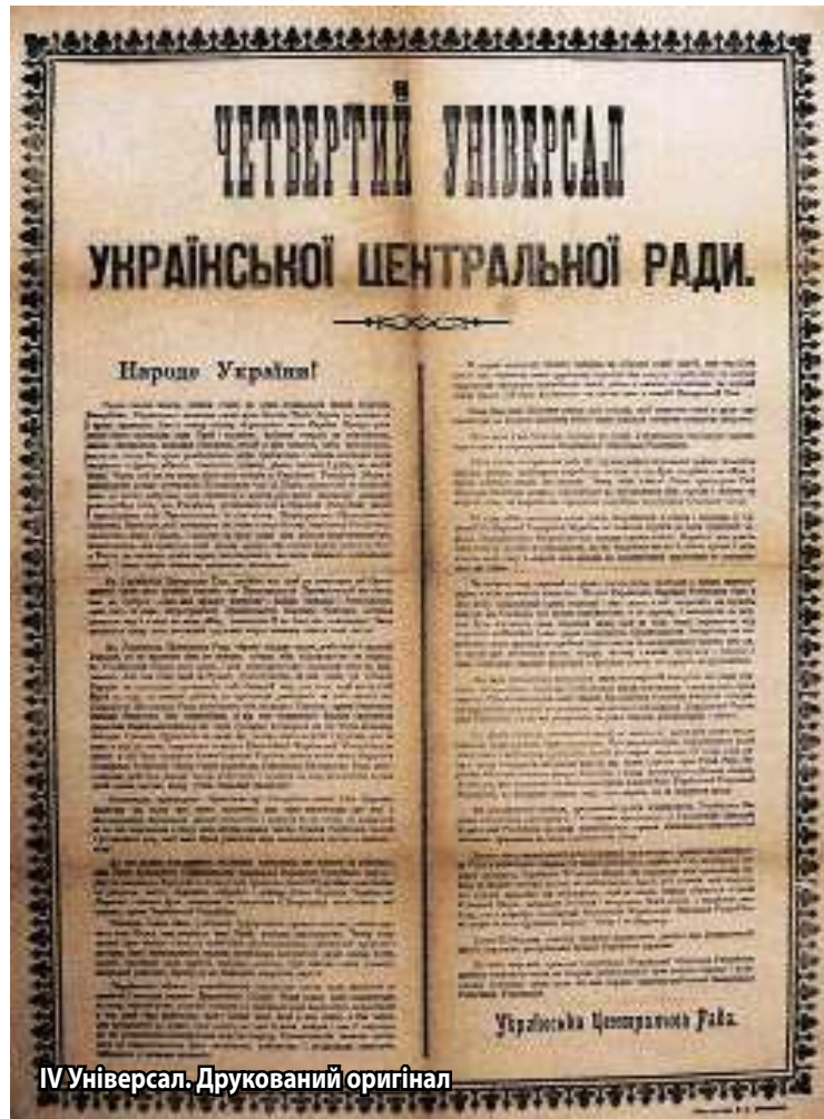
IV Універсал. Друкований оригінал

тральна Рада почала роботу над Четвертим Універсалом, який мав ствердити повну державну незалежність України. На розгляд було подано три проекти, які прийняли до роботи і доручили конституційній комісії УЦР об'єднати в один документ. 11 (24) січня узгоджений текст Четвертого Універсалу було подано на поіменне голосування, що завершилося вже далеко за північ. Переважною більшістю голосів Універсал було прийнято і Українська Народна Республіка проголошена «самостійною, ні від кого незалежною, вільною суверенною державою українського народу».