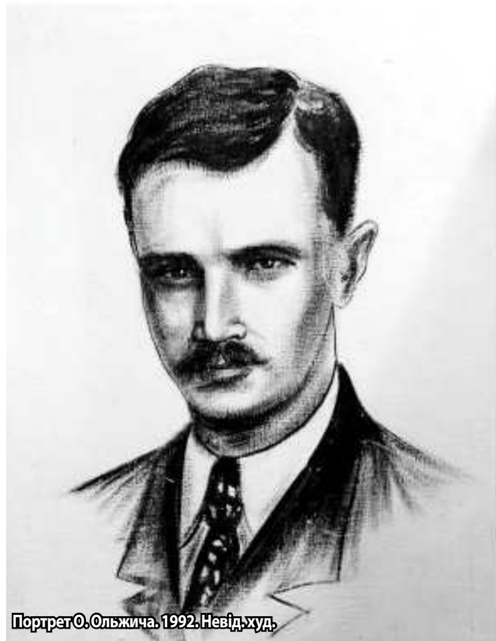
Портрет О. Ольжича. 1992. Невід'худ.

мали викинути, але дивом вони збереглися, щоб ми могли відчутти енергетику автора.