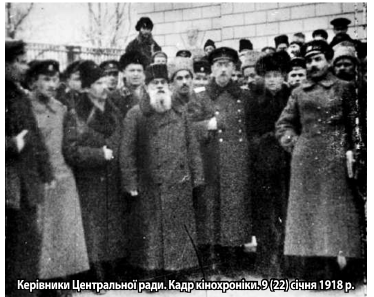
Керівники Центральної ради. Кадр кінохроніки, 9 (22) січня 1918 р.

Універсал містив основні положення доктрини національного державного будівництва: першочергові завдання – це укладення миру, ліквідація більшовицької загрози, проведення земельної реформи на користь селян, контроль банківської системи та торгівлі. Оголошено про розпуск республіки Російської армії, що перебували на території Украї-