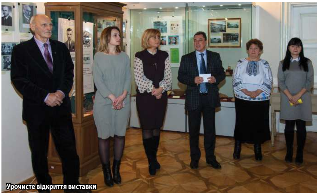
Урочисте відкриття виставки